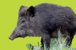
Jabalí ( Sus scrofa )