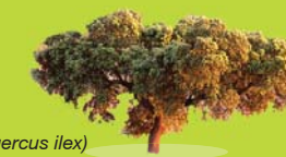
Encina ( Quercus ilex )